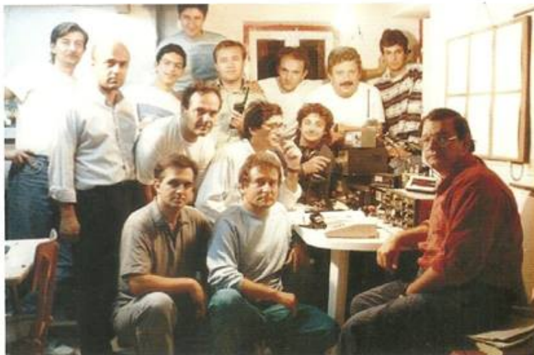
Ομάδα χειριστών του σταθμού σε αναμνηστική φωτογραφία.