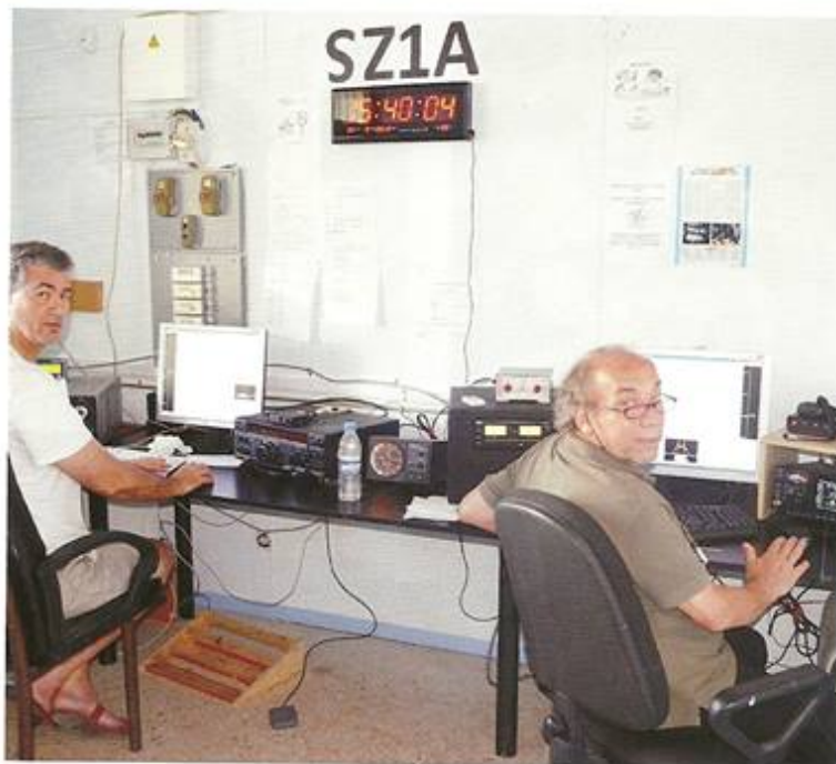
Στιγμιότυπο από τη συμμετοχή στο contest CQ WW RTTY το 2013.