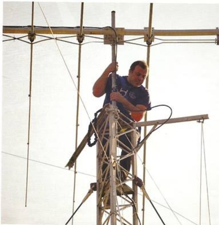
Οι κεραίες απαιτούν αγάπη, φροντίδα και ...συχνές επισκέψεις!

δεύτερος πομποδέκτης δίνει μεγάλο πλεονέκτημα, αφού μπορούμε με τον ένα να καλούμε CQ και με το άλλο να ψάχνουμε για πολλαπλασιαστές (multipliers). Έτσι το σκορ μεγαλώνει αρκετά.