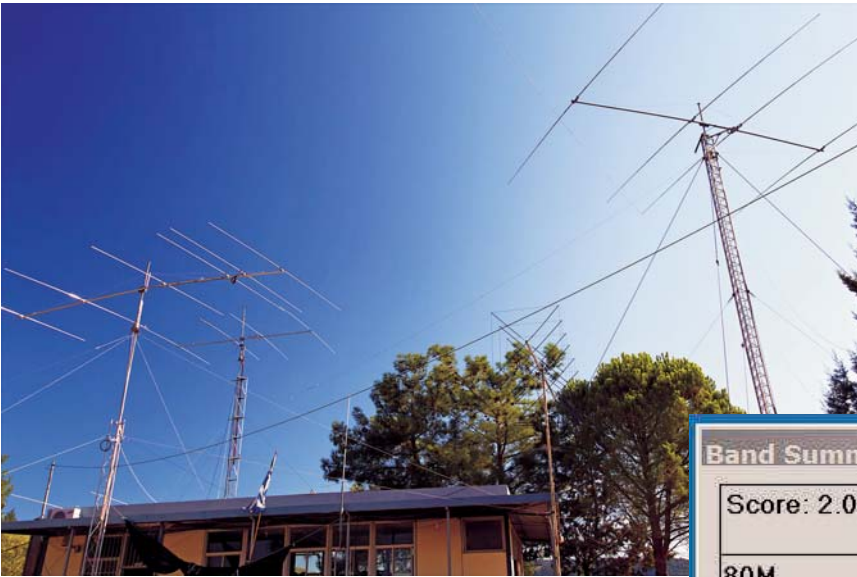
Πάνω, τα εργαλεία και δεξιά, τα αποτελέσματα!