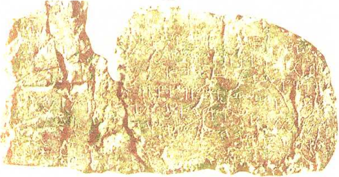
A Siloach felirat eredeti kőtáblája