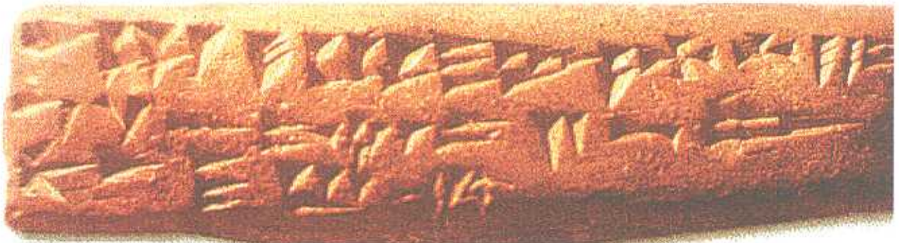
Az ugariti eredeti kőlap a rajta levő ékírás ábécével