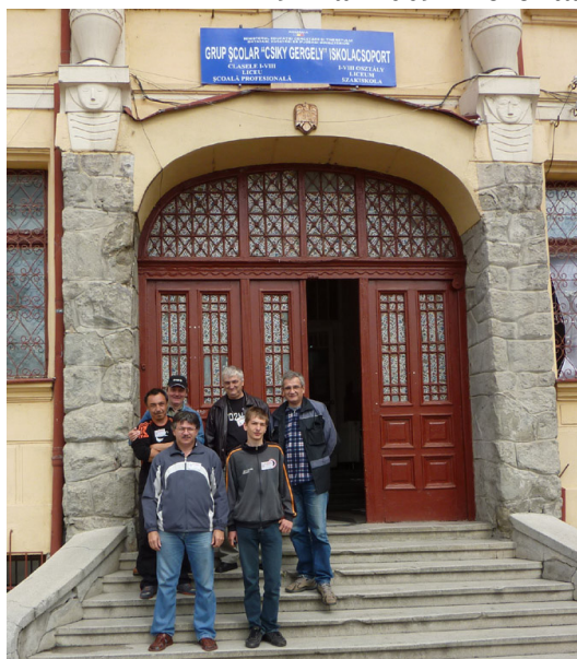
Organizatorii și prezentatorii