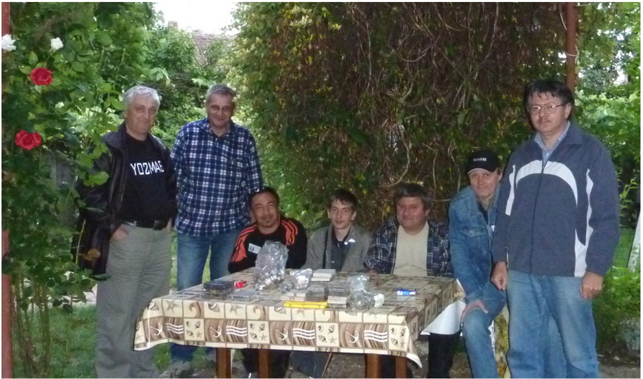
Echipa YO2MAB, YO2UE, HA8ML, HA8WE, YO2MJJ, HA8MP, HA8IG