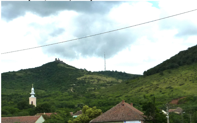
Vârful dealului Șiria