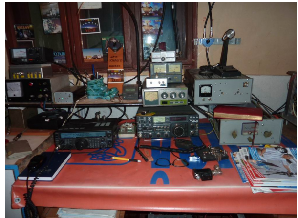
În drum spre Arad, l-am vizitat pe colegul YO2IL, care ne-a prezentat camera lui de radioamatorism

În dimineața duminicii de 31 mai 2009, am vizitat centrul municipiului Arad și am făcut o plimbare pe malul Mureșului. După masă am ajuns acasă la Békéscsaba.