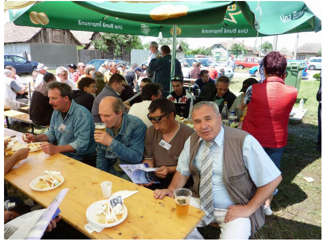
HA8AR, HA8MP, HA8ML, YO3APG