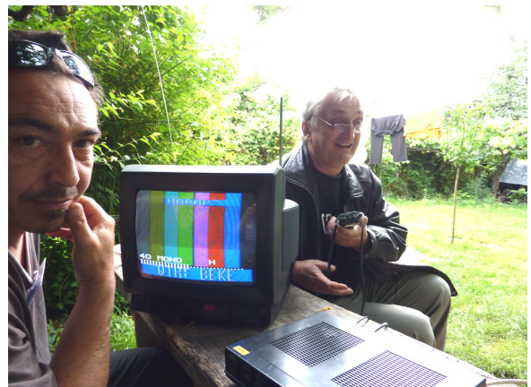
Recepția emisiunii ATV pe TV