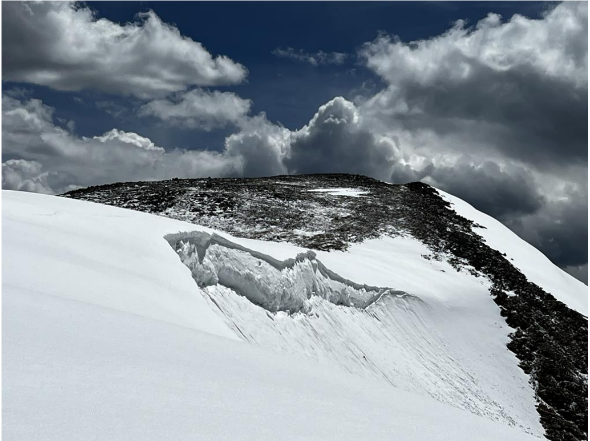
Die Schneeabbrüche haben wir sicher umgangen