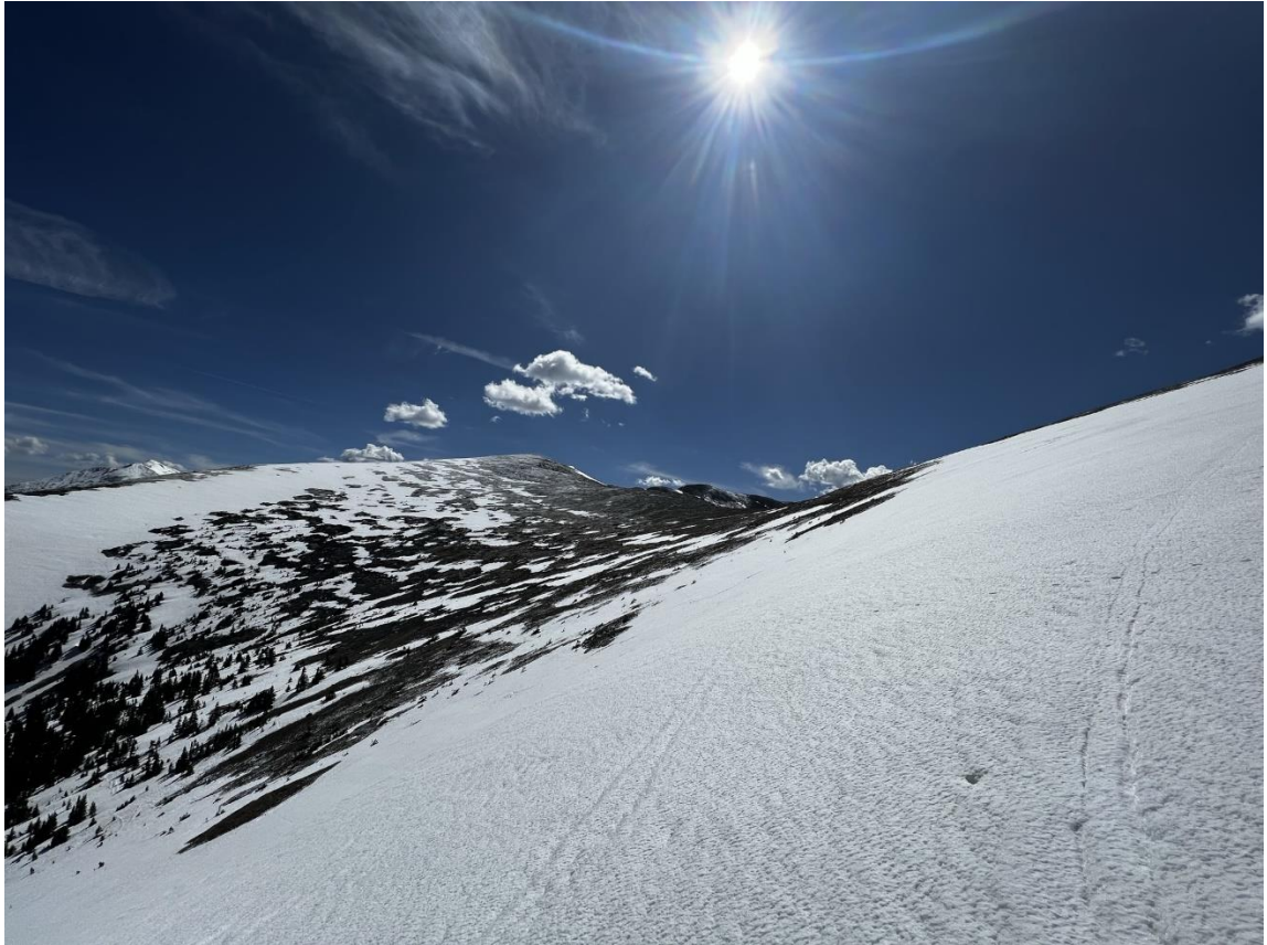
Psychologisch gut... nach einer halben Stunde straffen Aufstiegs zeigen sich schon Gipfel