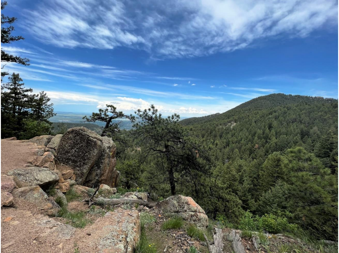
Blick zum Green Mountain WOC/FR-085