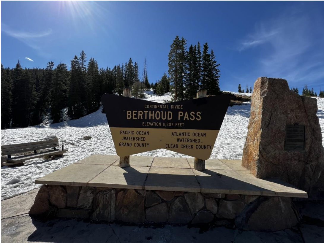
Der Berthoud Pass stellt die kontinentale Wasserscheide (Continental Divide) dar.

Matt, nicht nur Kenner der Berge in CO, sondern auch diverser Wetter-Apps, meinte, dass heute ein gutes Zeitfenster für einen 4000er bestehen könnte. Also zeitiges Frühstück und über die Interstate I 70 nach Idaho Springs und von dort über die US-40 auf ca. 3400m Höhe zum Berthoud Pass, wo unser Aufstieg zum Mt. Flora WOC/SR-035 (4001m) begann. Schon am Parkplatz erwartete uns ein großes Schneefeld und wir dachten kurz darüber nach, eine Alternative anzusteuern.