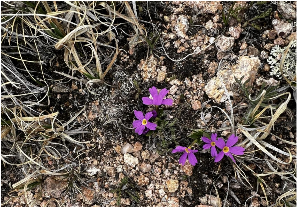
Blüten auf fast 4000m Höhe...

Mein erster 4000er und dann auch noch mit Funk. Mein Dank gilt Matt für diese geniale Tour.