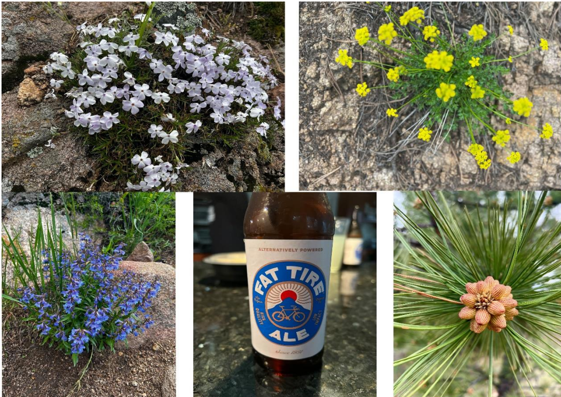
Die Auswahl an Blumen bereicherte am Abend die des Hopfengetränkes aus der Mitte. Im westlichen Colorado gibt es viele Privatbrauereien, deren Produkte durchaus trinkbar sind... im Gegensatz zu der bekannten Massenware...