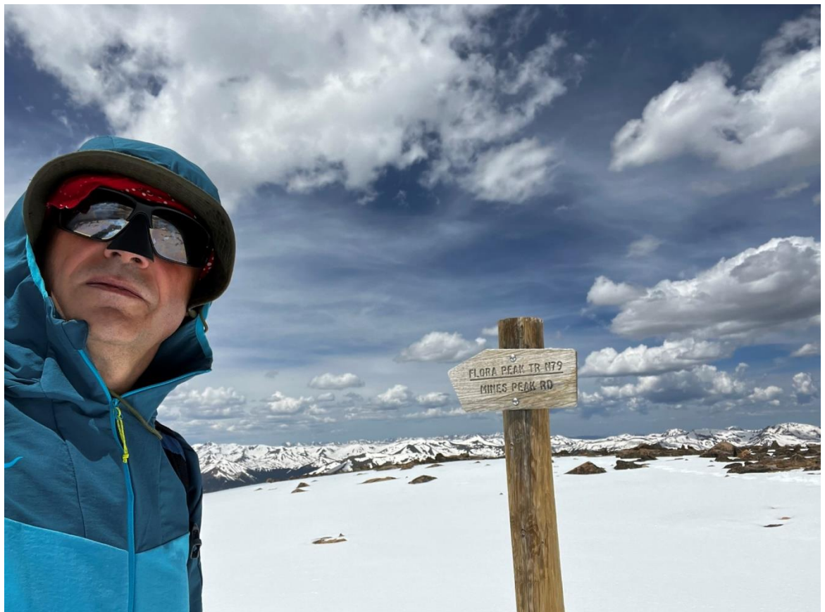
...endlich geschafft - über 2h Aufstieg