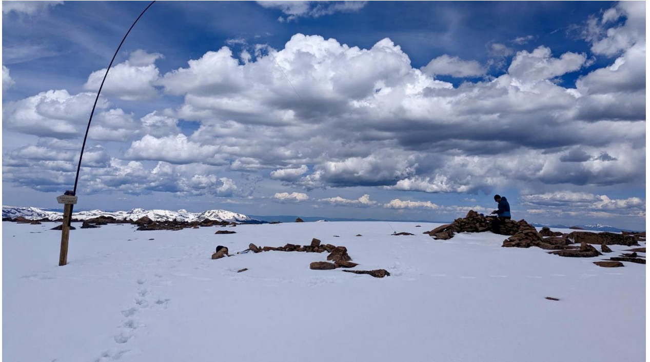
Auf dem Gipfel des Mt. Flora blieb wenig Zeit, da schon Donnerrollen zu hören war!