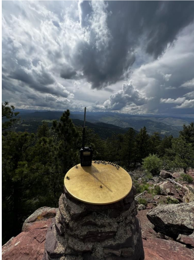
In der Nähe von Boulder und Denver sind viele Stationen auf 2m qrv