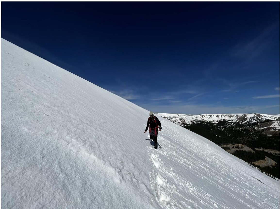
Matt, KOMOS beim Überqueren eines Schneefeldes. Es dauerte aber noch 1,5h bis zum Gipfel.