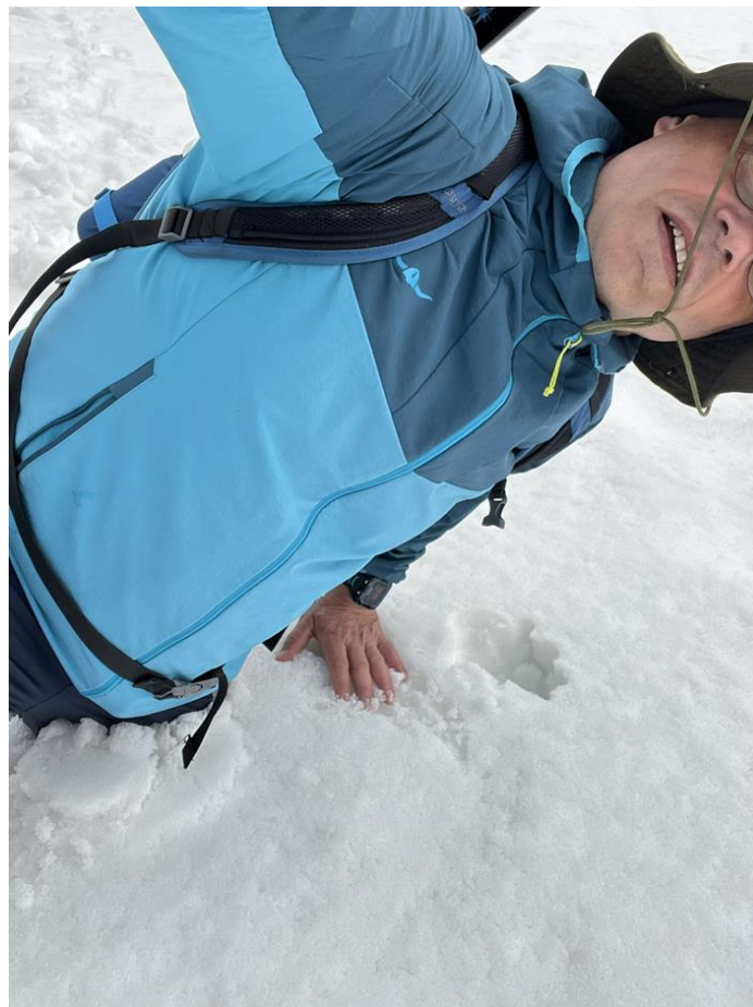
Der Abstieg brauchte fast 2h, da der Schnee durch die Sonneneinstrahlung weich wurde