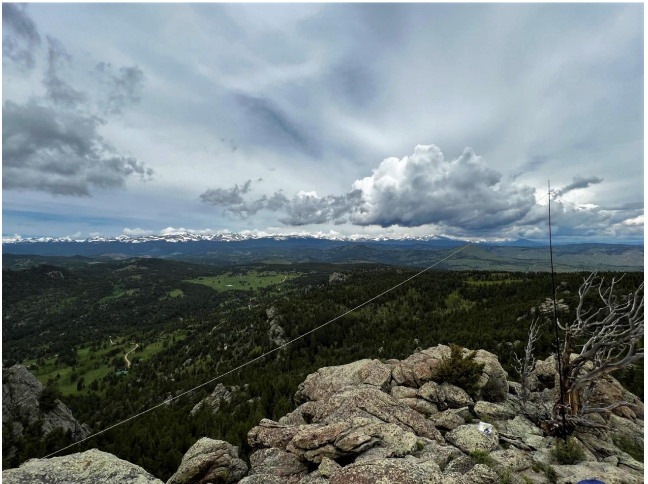
Twin Sister Peak WOC/FR-184

Nach straffem Marsch durch felsiges Gebiet erreichten wir nach 90min den Gipfel des Twin Sister Peaks, die Warnschilder vor Bär und Puma waren nur kurz verstörend. Schnell war die Endfeed-Antenne aufgebaut und mein fehlendes Batteriekabel durch Krokodilklemmen ersetzt.