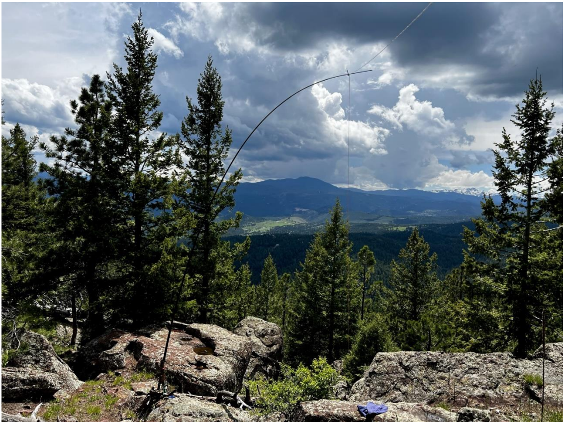
Sonnenschutz war wichtig... die Höhensonne auf 2500m wird unterschätzt