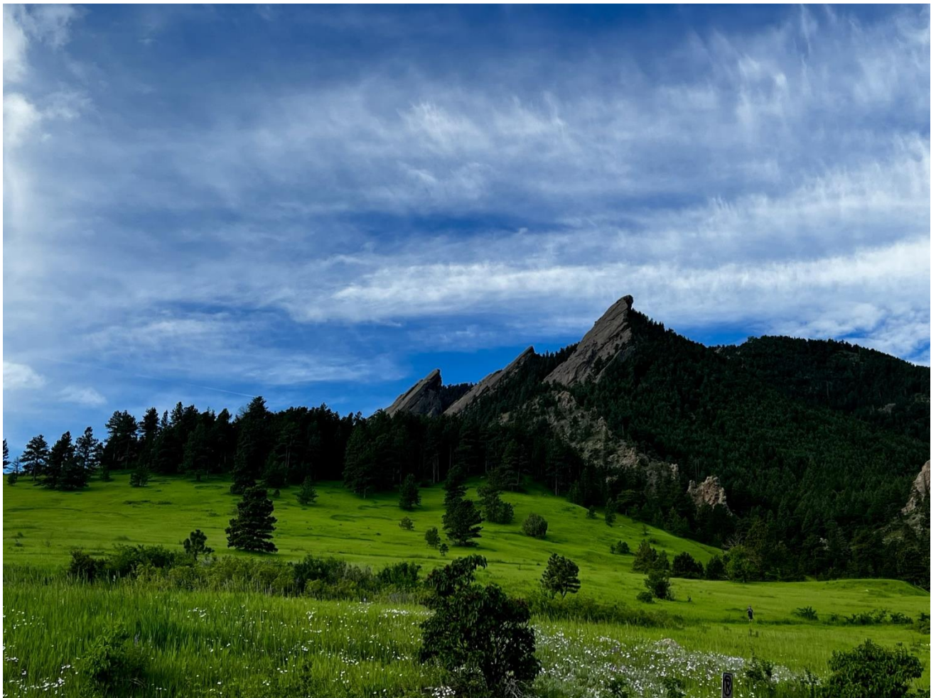
Flatirons, die westlich von Boulder gelegen sind

Für den nächsten Tag hatten wir 2 „kleine“ Berge vorgesehen. Vorbei an den Flatirons ging es hoch in Richtung Twin Sister Peak (2650m a.s.l.) WOC/FR-184. Auffallend war, dass es dieses Jahr ordentlich Schnee und Regen gab und sich die Gegend strahlend grün präsentierte.