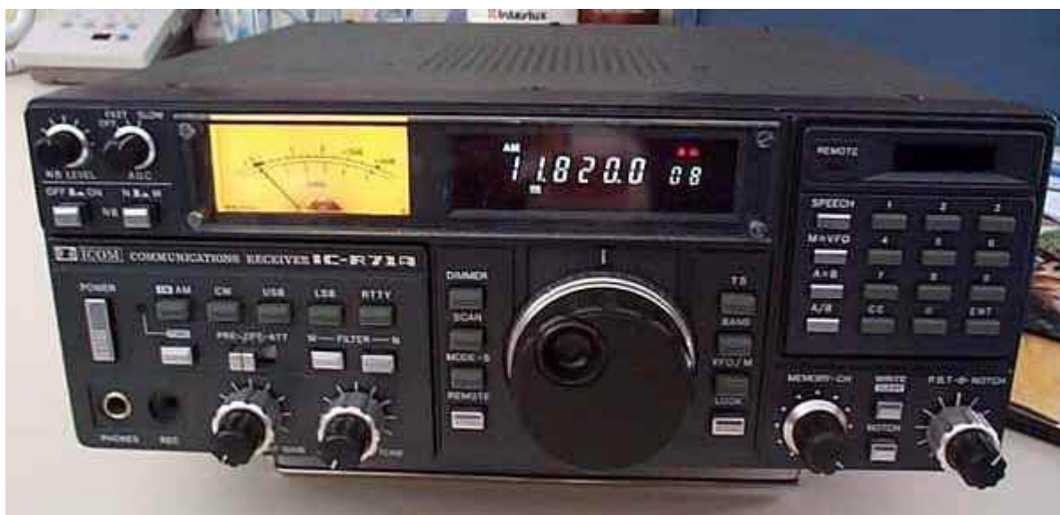
图 1 ICOM R71 接收机