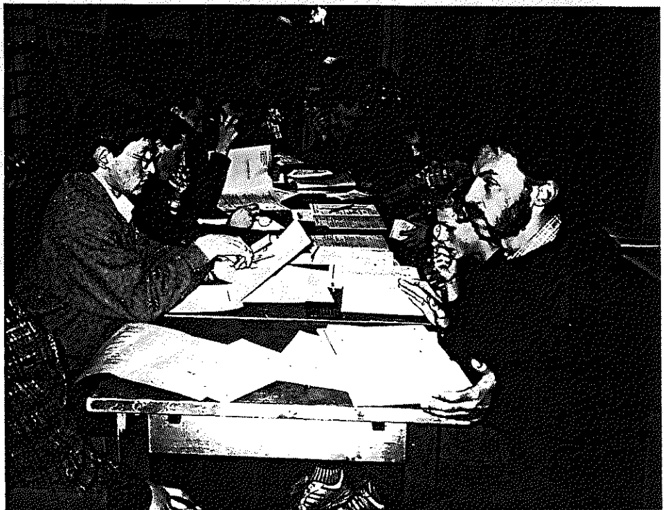
Сдача экзаменов в Ст. Петербурге на лицензии FCC. Ноябрь, 1995 г.