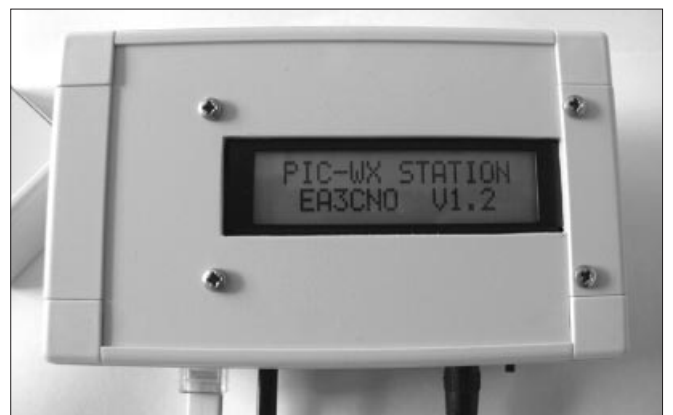
Figura 2. Estación montada y terminada, con la opción de sensores exteriores.

El sensor de presión atmosférica está montado en la placa base de la estación, puesto que esta medida barométrica es coincidente, tanto en el interior como en el exterior.