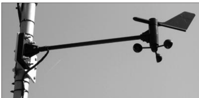
Figura 4. Anemómetro instalado en mástil.

Wx_aprs.hex . Esta versión nos permitirá medir los parámetros correspondientes a temperatura, humedad, presión atmosférica, velocidad y dirección del viento, así como transmitir