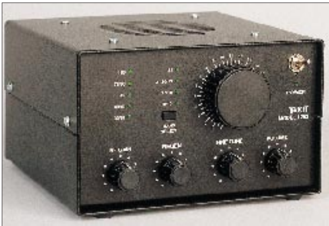
Frontansicht des Ten-Tec 1253. Um bestmögliche Empfangsergebnisse zu erzielen, ist das optimale Zusammenspiel von Frequenzfeinabstimmung (Fine Tune), Rückkopplung (Regen.) und HF-Verstärkung (RF Gain) wichtig.

Übersetzt man den Begriff „Regenerative Receiver“ und wirft einen Blick auf den Stromlaufplan, so offenbart sich hier ein Rückkopplungsempfänger bzw. Audion mit FET-Bestückung. Um Funktion, Leistungsfähigkeit und Bedienung (!) besser verstehen zu können, sei nachfolgend speziell für die jüngeren Leser der Rückkopplungsempfänger kurz erläutert.